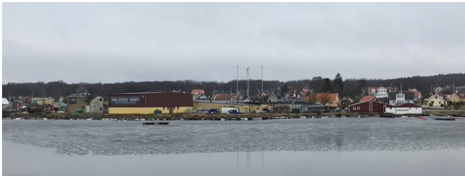
Figur 2: Nuvarande situationsläge.

Området är cirka 1,5 ha stort. Exploatering av planområdet medger byggnation av mindre flerbostadshus, se Figur 3. Andelen hårdgjorda ytor minskar (i jämförelse med dagens situation) i samband med exploateringen därmed ökar gröna ytor i motsvarande andel. Detta medför att flöden minskar inom planområdet efter exploatering.