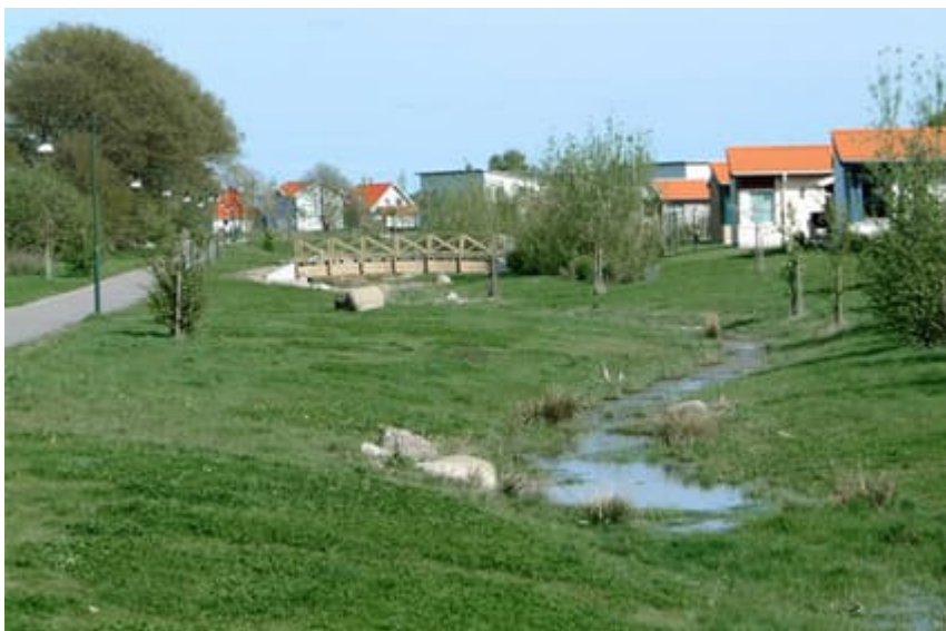
Figur 5: Exempel på dike/svackdiken.