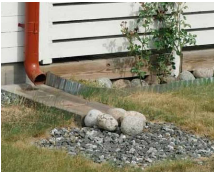
Figur 6: Stuprörutkastare med rännalsplattor med erosionsskydd som leder ut vattnet på gräsmatta.