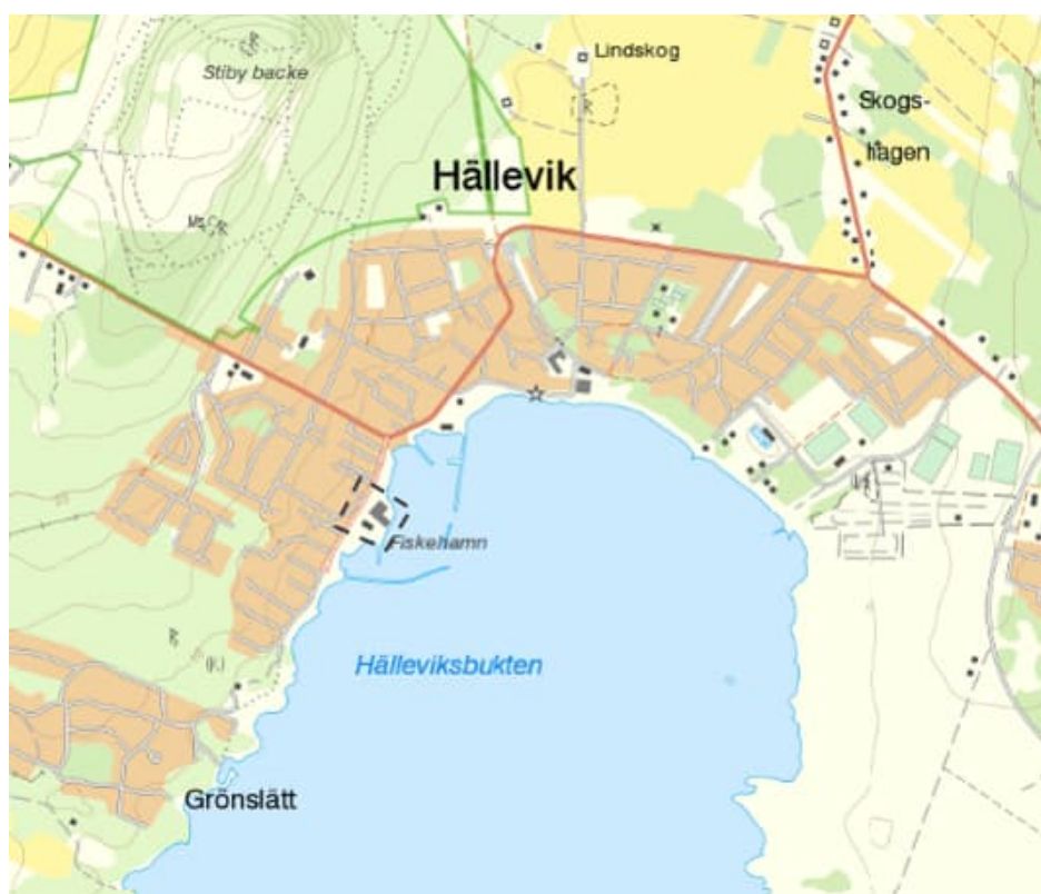
Figur 1: Översiktsskarta.

Denna dagvattenutredning tas fram för att utifrån områdets naturliga förutsättningar, såsom topografi och jordarter. Föreslag har tagits fram för en hållbar dagvattenhantering enligt den markanvändning som detaljplanen medger, se Figur 1.