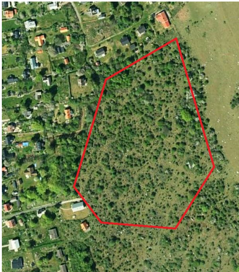
Figur 1. Undersökningsområdet markerat med röd polygon.

Samtliga nivåer i denna PM avser nivåer i RH 2000 om inget annat anges.