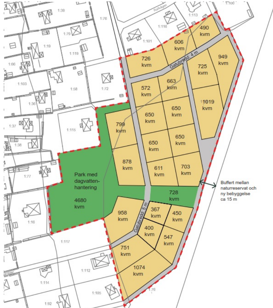
Figur 2: Skissförslag för nybebyggelse.

Området är planerat att användas till byggnation av nya fastigheter enligt skissförslag (Figur 2)