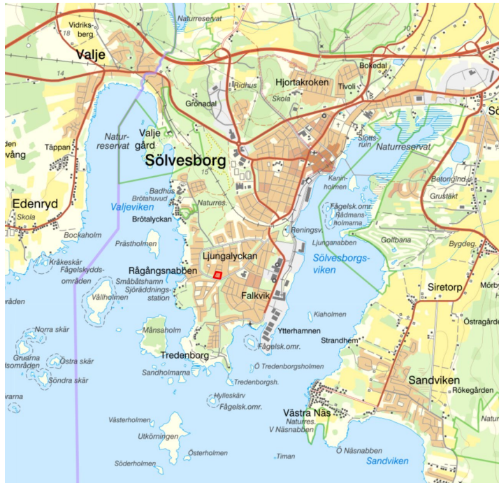
Planområdets läge i Sölvesborg