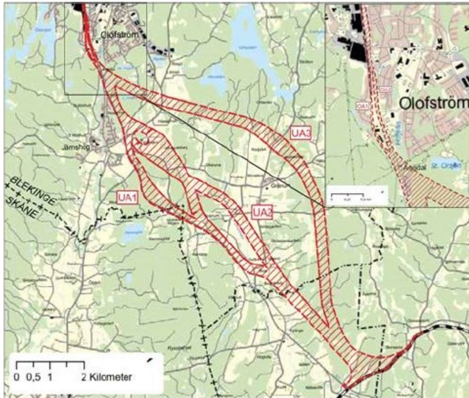
Figur 1.2 De studerade alternativen i järnvägsutredningen.