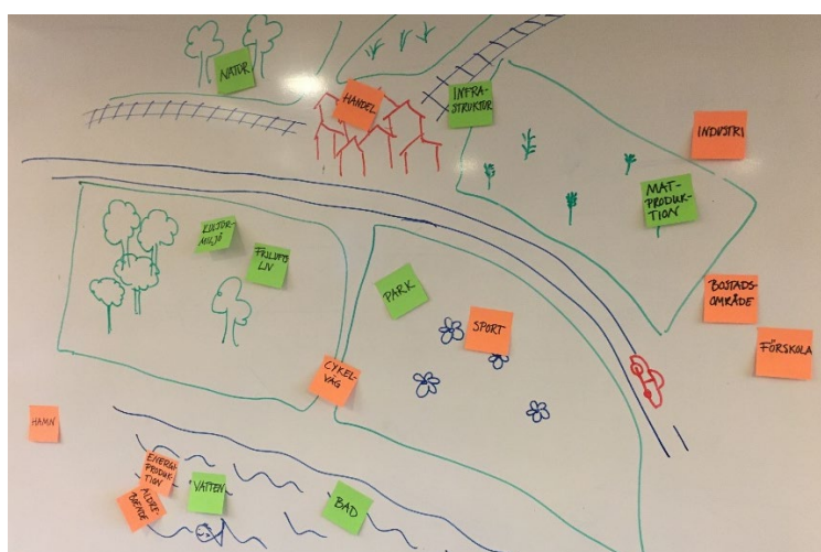
Foto från workshop med årskurs 9 Mjällby skola.

Elever i åk 9 på Mjällby skola har deltagit i den tidiga medborgardialogen vid ett tillfälle. Tjänstepersoner från kommunen träffade klassen och berättade om översiktsplanering, dess utmaningar och möjligheter. I en övning fick eleverna prova på att sätta ut olika mark- och vattenanvändningar för ett fiktivt område på en karta. De fick även svara på frågor om framtidens Sölvesborg. Även högstadieskolan i Sölvesborg, Bokelundskolan, har inbjudits till dialogprojekt men inte deltagit.