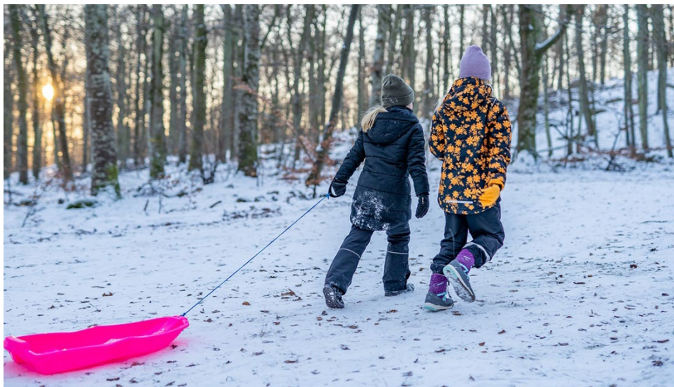
Pulkaåkning på Grisabacken, Sölvesborg.