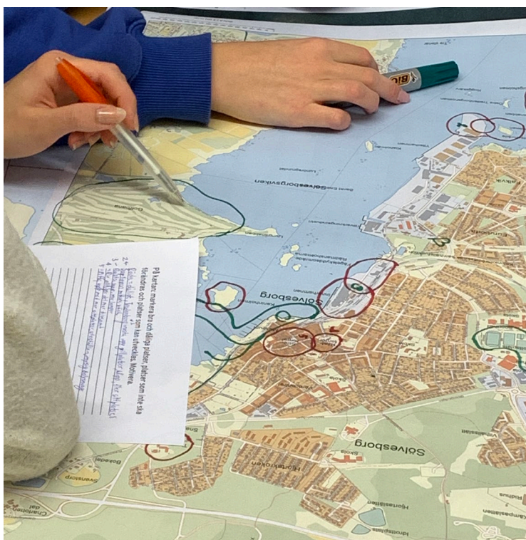
Foto från workshop med kartor på Furulundskolan.