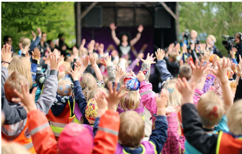
Barn på konsert på Skönabäckrocken.