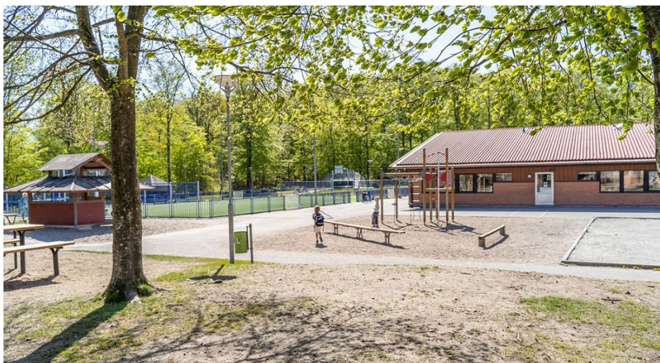
Foto över skolgården vid Hjortakroksskolan.