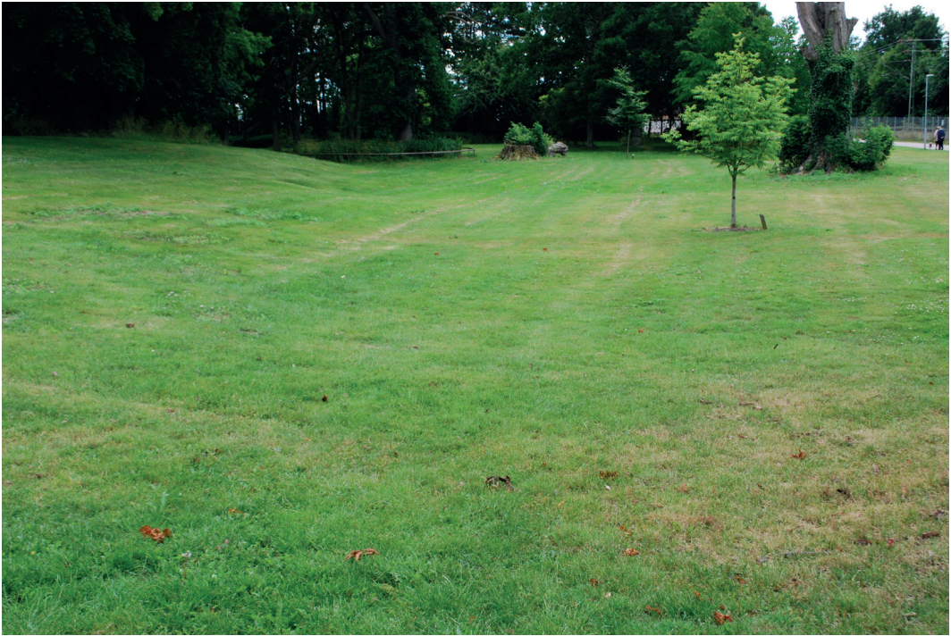
Fig. 5. Den yttre vallgraven kan i väster fortfarande anas i terrängen som en svag försänkning. – The western moat of the bailey can still be seen as a depression in the terrain.

Kindström tänkte sig att förborgen använts för stall och ekonomibyggnader. Några säkert medeltida byggnadslämningar har inte påträffats där. Förborgen utsattes för omfattande markarbeten under tidigt 1800-tal när det nuvarande slottet uppfördes. Raseringslager, påförda lager, men ävenstensatta ytor och källargrunder från 1600- och 1700-talen har framkommit på skilda platser (Åstrand 2013; 2021a, s. 45). 1725 års karta visar endast två vinkelställda längor omedelbart väster om den inre borgkullen. 14 C-dateringarna från botten av den yttre vallgraven visar dock att förborgen sannolikt tillkommit samtidigt med kärntornet och den inre borgplatån under 1300-talet. Precis som för borgkullen visade undersökningen 2013 att de lager som bygger upp förborgen till stora delar utgörs av påförda massor. Detta tyder också på att förborgen är ett resultat av ett omfattande arbete. Man har inte bara uppfört borgkullen utan även stora delar av förborgen