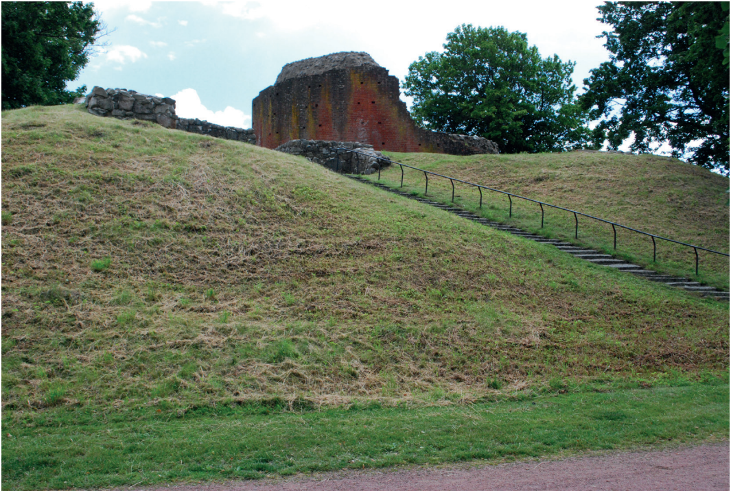
Fig. 2. Den inre borgkullen i Sölvesborg med tornet och grunden av porthuset i förgrunden. Foto från norr: Martin Hansson 2022. – The motte in Sölvesborg and the remains of the gatehouse in the front.

uttryckligen som borg. I det andra diplommet (SDHK 4827) förklarar samma Knut Folkeson att han av kung Magnus på tre år, mot en årlig avgift av 500 mark skånska penningar, mottagit Blekinge och Lister med alla avgifter och kungliga rättigheter, med vissa undantag. Knut Folkeson förbinder sig dessutom att på egen bekostnad underhålla besättning på Sölvesborg för skatternas indrivande och borgens försvar, att upptaga och redovisa de gårdar kungen kan komma att pålägga och efter kungens föreskrift använda borgbyggnadshjälpen och ha tillsyn över byggnadsarbetet. Det är tydligt att det vid denna tid pågick byggnadsarbeten på borgen.