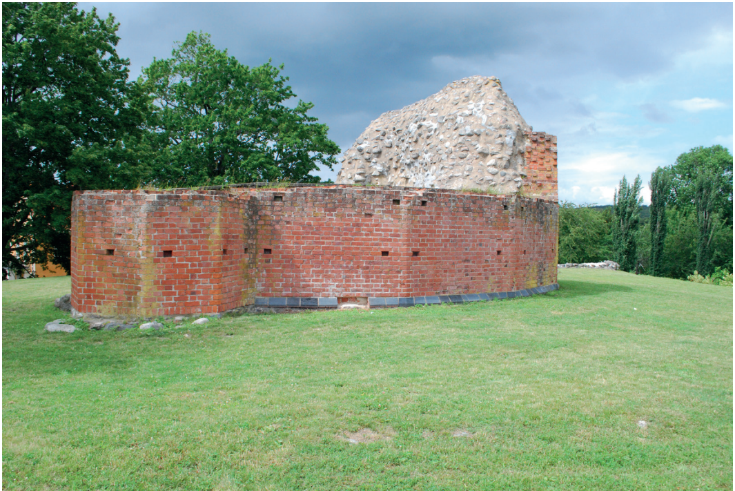
Fig. 4. Kvarvarande renoverade delar av det stora borgtornet med tillhörande trapptorn. – The present restored remains of the keep with the stair tower.

Den inre delen av borgen består av en stor, konstgjord och närmast fyrsidig kulle av jord, med en bottendiameter på 65–70 m. I den syd-västra delen är borgkullen skadad varför stora delar av den södra delen av borgplatån var förstörd innan Lars-Göran Kindström på 1940-talet genomförde sina undersökningar. I samband med dessa återställdes denna skada varför borgplatån idag ser ”hel” ut på ytan. Skadan i kullen gjorde dock att det gick att fastställa att denna är konstgjord (Kindström 1945, s. 43). Kullen är 8,5–9 m hög och dess övre platå, där byggnaderna legat, är 38–40 m i sida, dvs. ca 1 500 m 2 stor. Kullen består således av uppmot