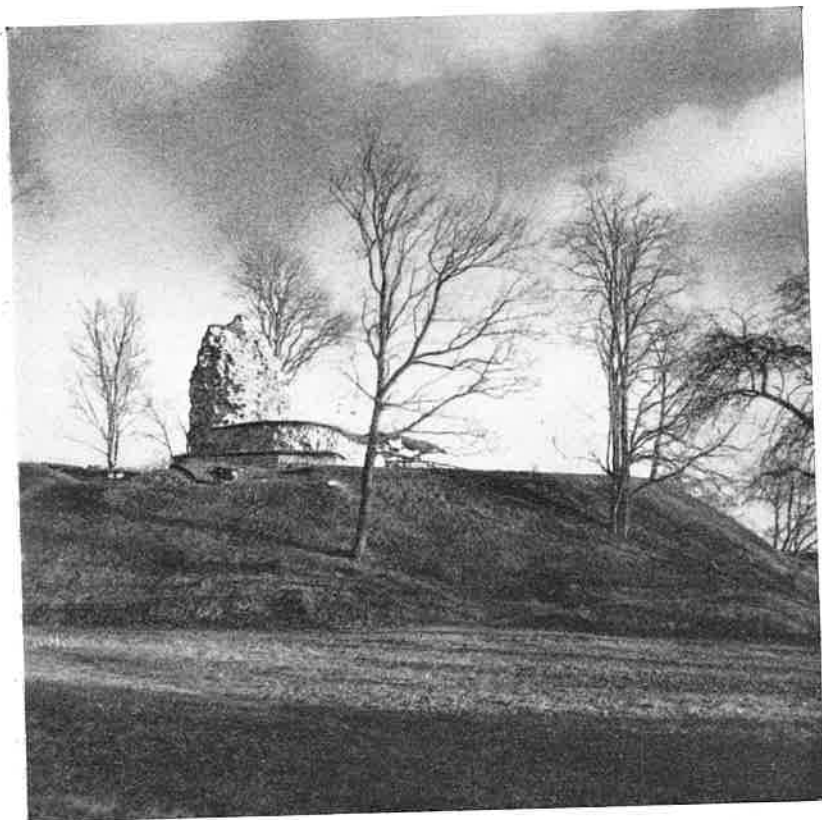
Sölvesborgs slottsruin vid konserveringsarbetenas avslutning i november 1942.

de år. Det har varit en ganska primitiv byggnad, troligen uppförd av trä i skiftesverk på den av en enkel stenrad bestående grunden. Mer än en våning kan det gärna ej ha varit. En, troligen två ingångar (en stor tröskelsten finnes ännu kvar på sin plats) ha funnits på dess västra sida, alltså från borggården, och i söder på östra sidan har en spis varit utbyggd. I större delen av detta kokhus, om det nu varit ett sådant, har tegelgolv varit inlagt, vilket tyvärr är synnerligen illa åtgånget. Huset tycks ha förstörts genom brand, då ett tjockt lager träkol och aska täckte grunden i dess helhet. Undersökningarna utfördes här endast så, att husets konturer konstaterades, varefter hela området inom stengrunden åter övertäcktes och den så uppkomna planen besåddes med gräs. Vid en kommande grävning bör detta område fullständigt undersökas och jorden sållas.