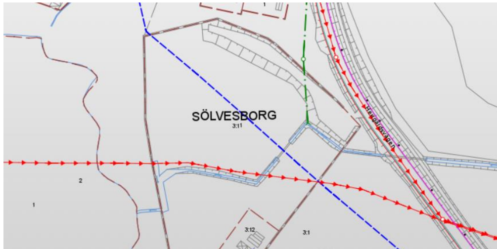
Figur 3 Befintliga ledningar samt dike

Ett dike går genom området och kommer att behöva ledas om och delvis kulverteras.