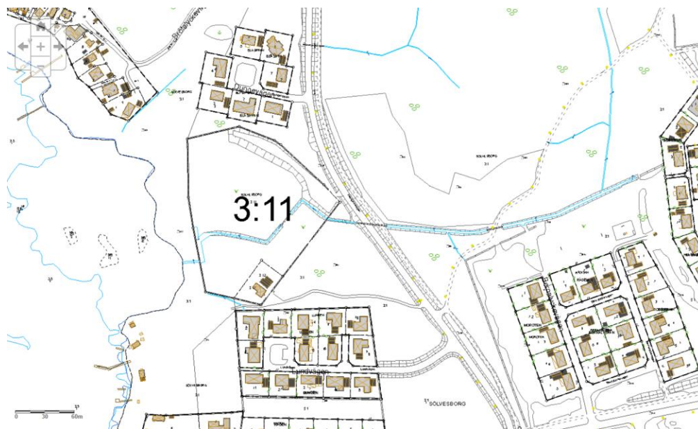
Figur 1 Markanvisningsområde

Området ligger väster om Herrgårdsvägen mellan Lundvägen och Dungevägen i Sölvesborgs kommun.