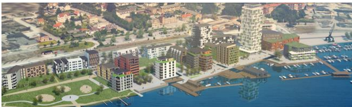
Visionsbild av projektet Solixx

Nedan listas de byggnadsplaner som i skrivande stund finns i samband med projektet Solixx, vars vision är att skapa en helt ny attraktiv stadsdel i Sölvesborgs innerhamn.