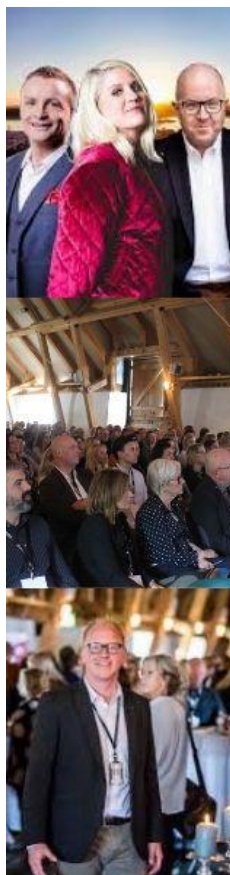
Bilder från Näringslivsdagen 2019